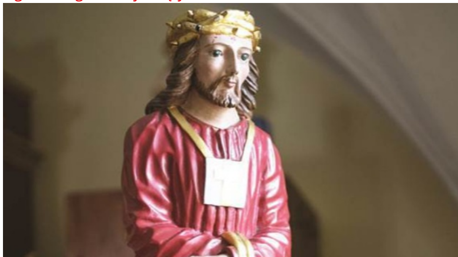
Figura z ceglowskiej świątyni

W harmonogramie wydarzeń realizowanych w ramach Stolicy Kultury Mazowsza 2021 znajdziemy takie wydarzenia jak: „Mazowiecki Przegląd Piosenki Znanej i Nieznanej STRUNA”, „Noc w Muzeum Konstantego Laszczki w Dobrem”, cykl „Zapoznanie z gen. Józefem Hallerem”: Konferencja naukowa „20 lat z Hallerem”, „III Błękitny Bieg w hołdzie gen. Józefowi Hallerowi”, a także „Święto Miasta Sulejówek – Dzień Marszałka” czy „Jarmark folkowy w Wilkowyjach”, na który wraz z organizatorami serdecznie zapraszamy wszystkich mieszkańców Mazowsza.