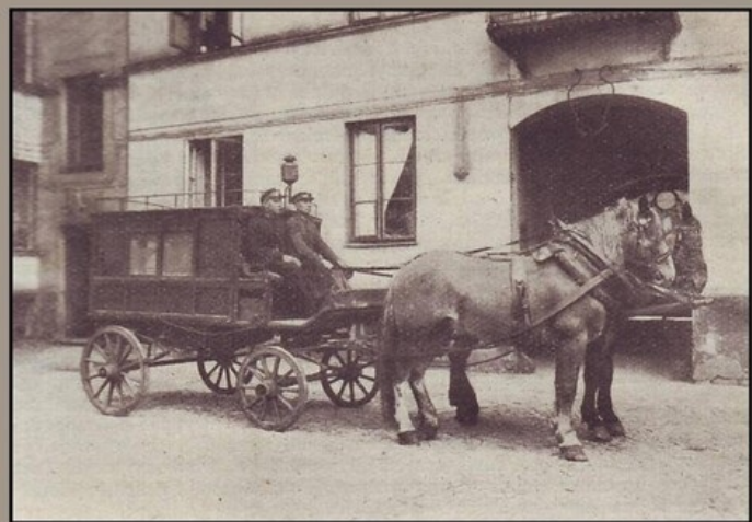
Pierwsza Karetka Pogotowia Ratunkowego „Konstanty”, 1897

Pierwsza stacja pogotowia ratunkowego w stolicy ruszyła 124 lata temu.