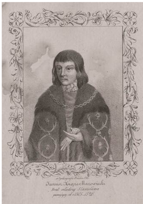
Autor: Fot. Ryc. Janusz Xiąże Mazowiecki

Po bezpotomnej śmierci ostatniego Piasta mazowieckiego, zgodnie z prawem, księstwo przechodziło pod panowanie króla polskiego. Wprawdzie żyły wciąż dwie Piastówny, ale prawo dziedziczenia tronu ich nie uwzględniało.