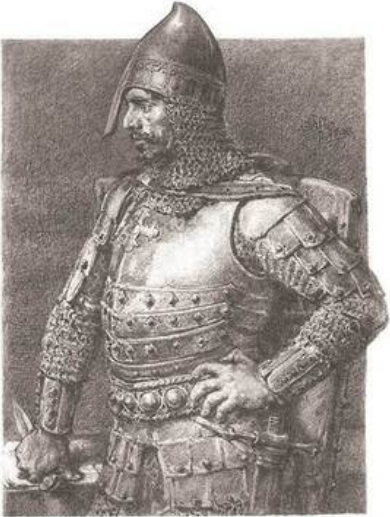
Fot. Ryc. „Królowie i książęta: Rysunki Jana Matejki” tabl. 17, nr sygn. A.2917/repr.xix/iv-27, Polona.pl

Konrad I był założycielem mazowieckiej dynastii Piastów, która trwała przez 10 pokoleń.