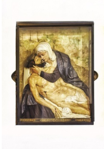
UMIG GÓRA KALWARIA

Najcenniejszy sakralny zabytek Góry Kalwarii to woskowa Pieta.