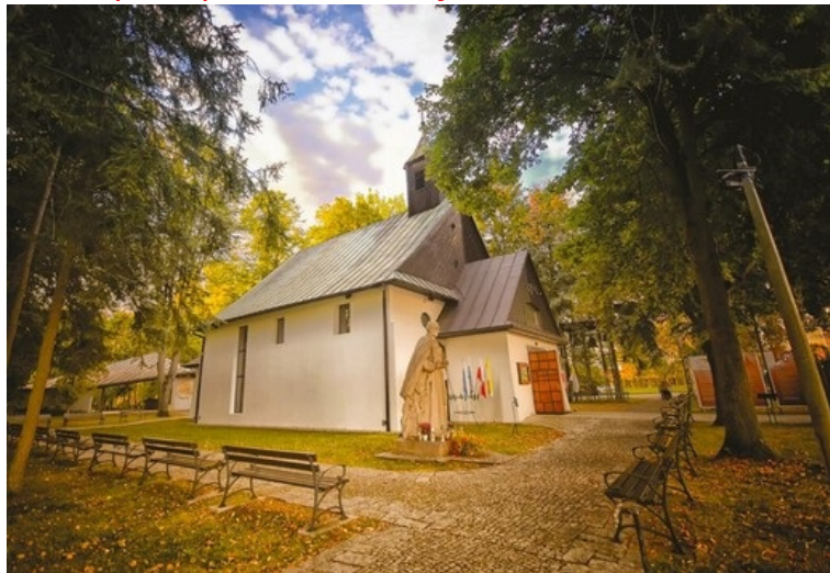
UMIG GÓRA KALWARIA

Najcenniejszy sakralny zabytek Góry Kalwarii to woskowa Pieta.