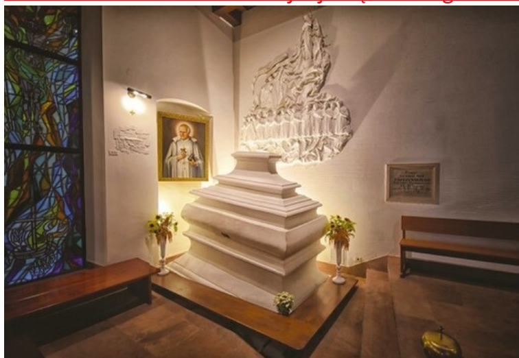
UMIG GÓRA KALWARIA

W kościele na Mariankach znajduje się sarkofag św. Stanisława Papczyńskiego.