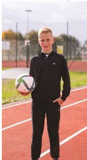
PIXEL STUDIO JAN JAKUB SMARCZEWSKI