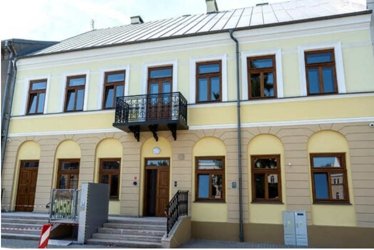
Wyróżnienie w kategorii rejestr zabytków: budynek sanatorium przeciwgruźliczego przy al. Teodora Dunina 1 w Rudce