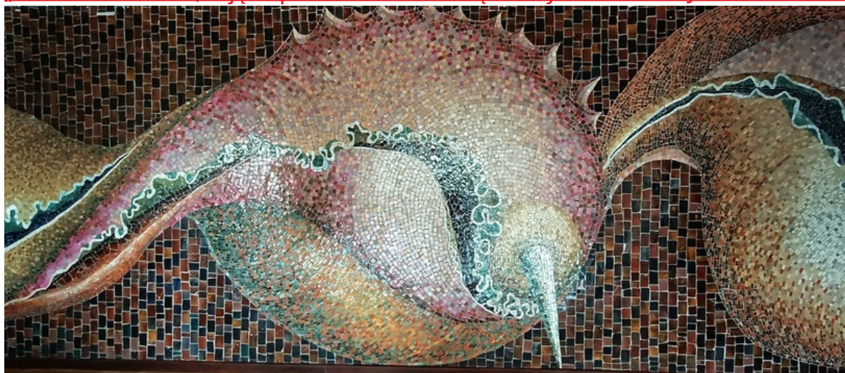
fot. Oliwia Marzec

„Podwodna sztuka”, zdjęcie przedstawia mozaikę we foyer - Teatr im. Jana Kochanowskiego w Radomiu